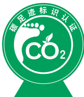
图 1：碳足迹标识认证标志

认证委托人可在通过认证的产品包装、随附文件（如说明书、合格证等）、电子销售平台等位置使用或展示种植业农产品碳足迹标识认证标志，并可以按照比例放大或者缩小，但不得改变标志中图形的板色、形状和文字。